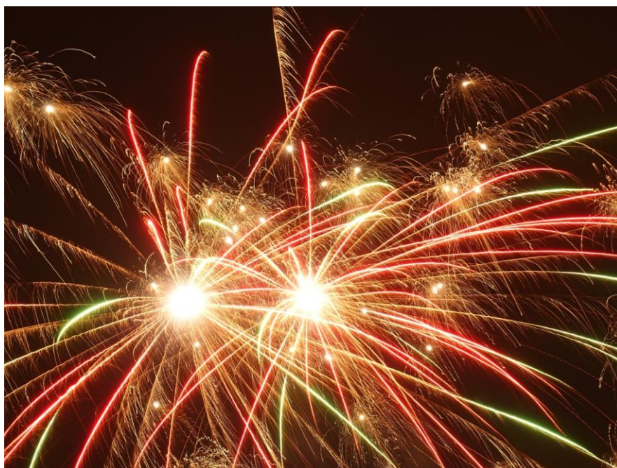
Silvesterfeuerwerk in Reykjavik

Verlängerungsoption und Buchungskontakte siehe nächste Seite.