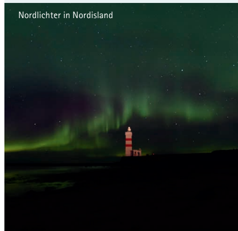
Nordlichter in Nordisland