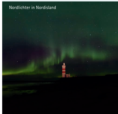
Nordlichter in Nordisland